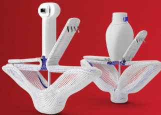
PASCAL Precision Transcatheter Valve Repair System